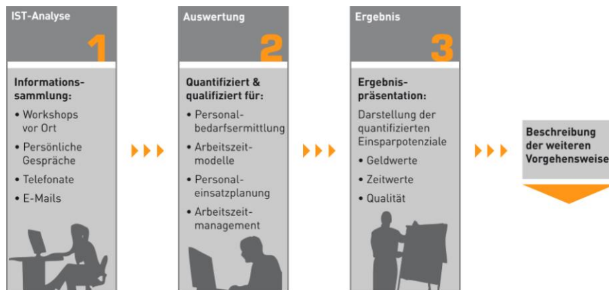
Abbildung 2: Der Potenzialanalyse liegt ein definiertes Vorgehensmodell zugrunde

Der Umfang der ATOSS Potenzialanalyse richtet sich nach den Anforderungen und der Komplexität des Unternehmens. Um die Analyse vorbereiten zu können und ein erstes Bild über die Unternehmensorganisation zu erhalten, haben ATOSS Consultants einen Online-Fragebogen entwickelt. Dieser wird vor der eigentlichen Analyse ausgefüllt. Die Beantwortung der Fragen dauert rund fünf Minuten. Es ist möglich, innerhalb des Online-Fragebogens vor und zurück zu gehen und Angaben zu korrigieren. Das Ausfüllen kann jederzeit unterbrochen und zu einem späteren Zeitpunkt fortgesetzt werden. Voraussetzung ist lediglich, dass der Browser Cookies zulässt. Das Online-Formular für den Fragebogen steht auf der ATOSS Homepage bereit.