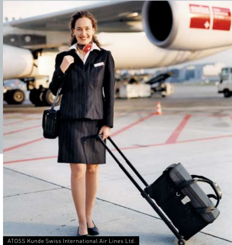
ATOSS Kunde Swiss International Air Lines Ltd.