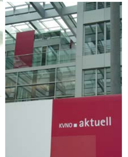
Kassenärztliche Vereinigung Nordrhein: Kunde seit 1999, 2005 auf die neue ATOSS Staff Efficiency Suite 3 migriert