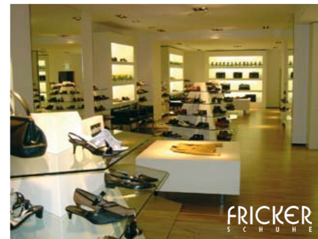
Fricker Schuhe, Schweiz: ATOSS Kunde seit 2002