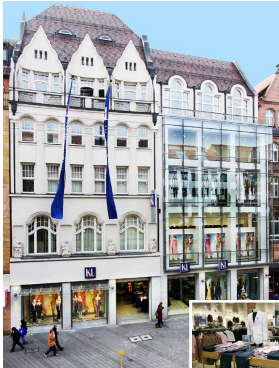
K&L Ruppert: ATOSS Kunde seit 2006