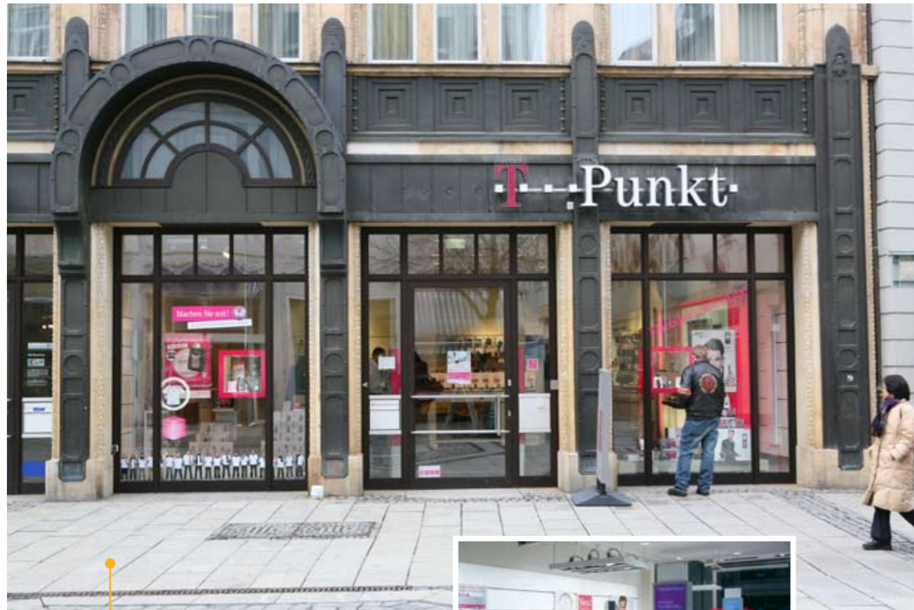
T-Punkt Vertriebsgesellschaft: ATOSS Kunde seit 2006