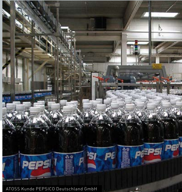
ATOSS Kunde PEPSICO Deutschland GmbH

In diesem Zuge erhöhten die Analysten der SES Research am 23.03.2007 bei gleichem Kursziel ihr Rating auf „Kaufen“ und insbesondere vor dem Hintergrund der Hauptversammlung und der vorgeschlagenen Dividende von 0,24 € erholte sich der Kurs bis zur Hauptversammlung.