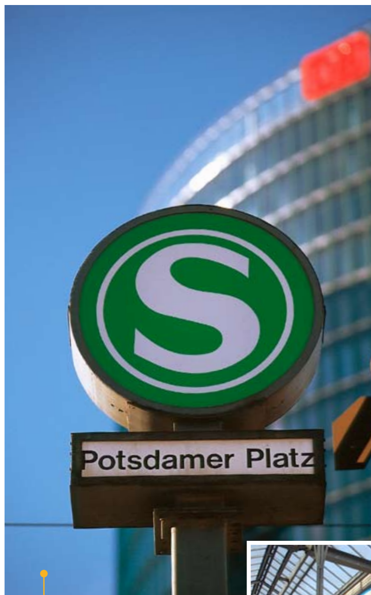
S-Bahn Berlin: ATOSS Kunde seit 1997