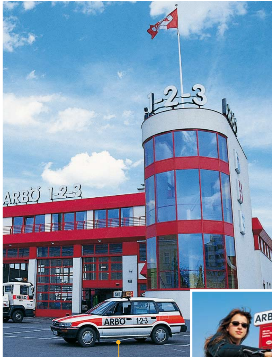
ARBÖ, Österreich: ATOSS Kunde seit 2000