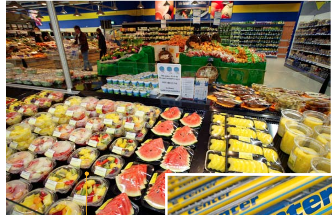
EDEKA Minden: ATOSS Kunde seit 2004

(1) Stück zum Quartalsende; (2) Cashflow, Finanzmittelfonds und EPS: bezogen auf durchschnittlich im Umlauf befindliche Aktien