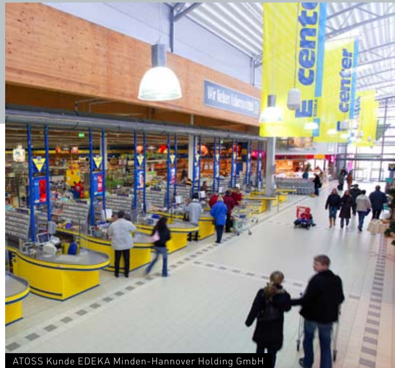
ATOSS Kunde EDEKA Minden-Hannover Holding GmbH