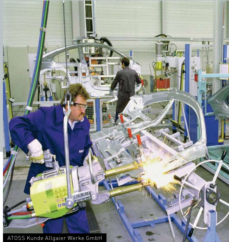
ATOSS Kunde Allgaier Werke GmbH

Jetzt erhöhten die Analysten der SES Research am 23.03.2007 bei gleichem Kursziel ihr Rating auf „Kaufen“. Vor dem Hintergrund der bevorstehenden Hauptversammlung und der vorgeschlagenen Dividende von 0,24 € erholte sich der Kurs bis zur Hauptversammlung.